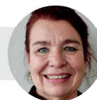
Text & foto: Kiki Alberius-Forsman redaktör, Mariehamn

I år tackar vi särskilt fotoklubben Obscura, med ordförande Miina Fagerlund, som bidragit med underbara bilder.