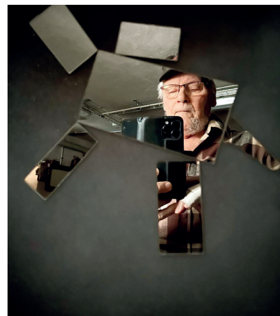
Skärvor av ett liv, ett självporträtt.

I källaren på ett stort, grått hus i Jomala Gölby öppnar sig ett stilrent, finurligt skaparkaos, vackert för ögat, lugnande för sinnet. Här finns allehanda metallskrot, pottor och plåtar, nycklar och klädnypor, snören, kaffekannor och en halv fiol. Här hittar vi årets konstnär Rainer Jansson, pysslare och livsfilosof.