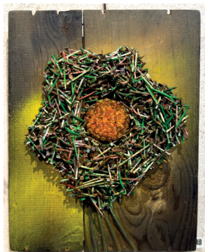
Blomma av spikar.