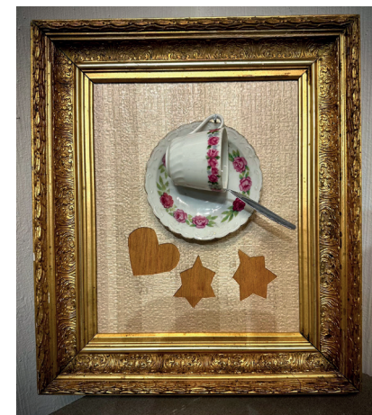
Får det vara en kopp? Eller får det vara?

skrothögarna omkring mig för att se om något passar ihop, så borrar jag hål, gängar, skruvar och svetsar. Ofta gör jag om, gång på gång, många gånger. Konsten är att sätta punkt, att veta när arbetet är färdigt.