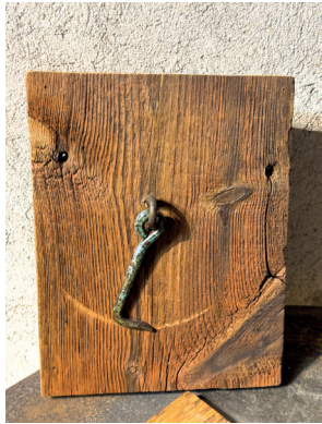
Visst ser vi ett godmodigt ansikte?