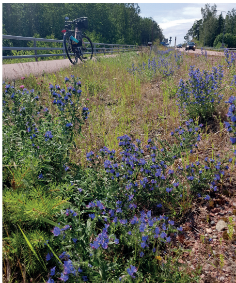
Blåelden längs våra vägar skapar en drömsk färdväg. Vad vill blåelden säga oss?