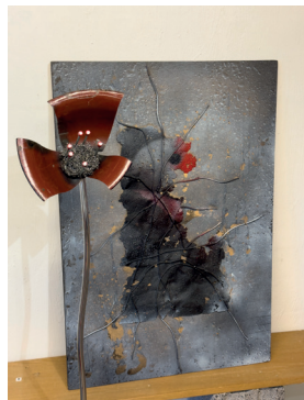
Det gäller att sätta punkt vid exakt rätt tillfälle.

– Det var en rattfull som körde på henne. Hon avled direkt. Det var grymt, orimligt och helt onödigt att en så ung flicka ska behöva gå bort, säger han.