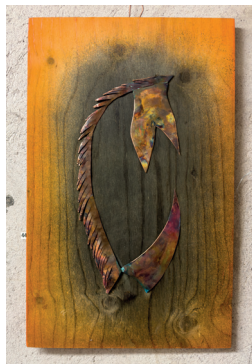
En lie blir en tulpan.