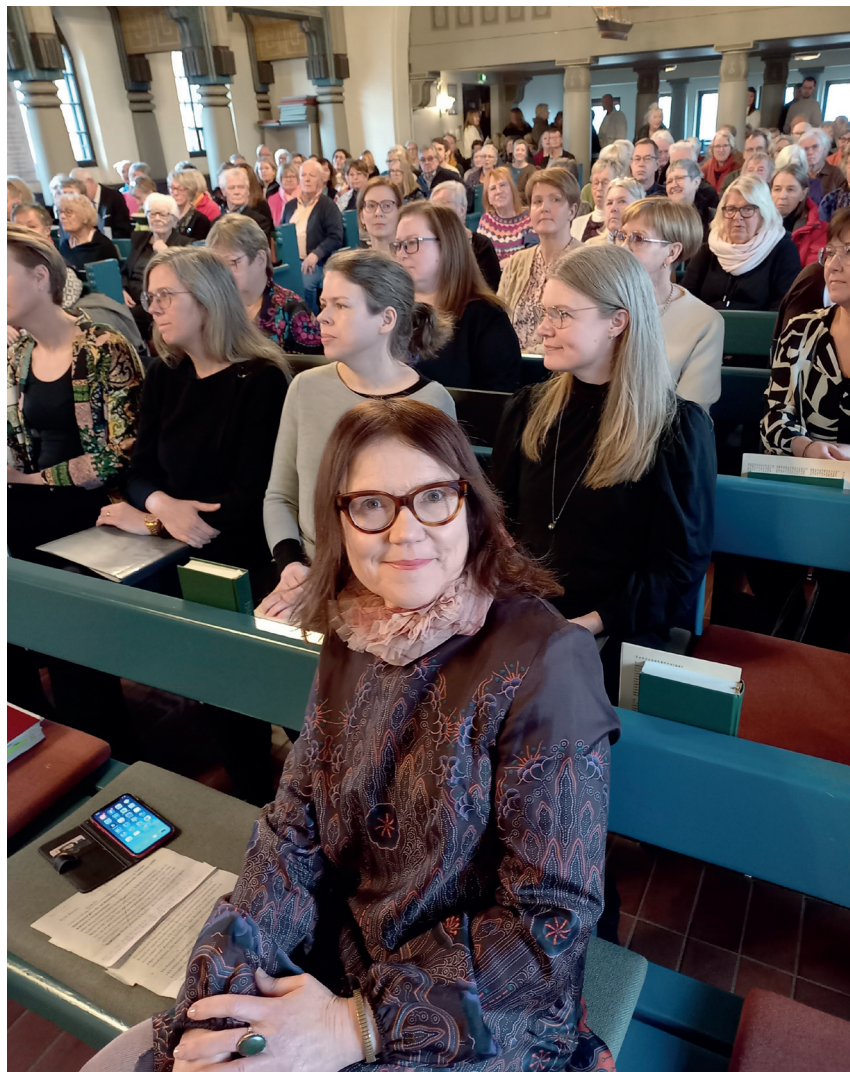
Sanningens kraft trots allt ett bättre skydd än världens starkaste armé, sa författaren Rosa Liksom i sin predikan under litteraturdagarna.

Rosa Liksom Litterär predikan på Mariehamns litteraturdagar i Sankt Görans kyrka 24 mars 2024